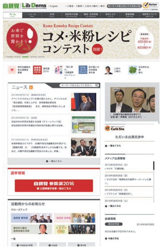
図-3 自民党のウェブサイト中央の青年局へのバナー (8)

の活動を活発化させている。自民党の学生部は、主に大学生によって構成されていて、1967年に党本部直轄から自民党東京都連に移管された組織である。2016年時点で、全国に14の学生部がある。2010年以後、主に地方において学生部の新設や活動へのテコ入れが相次いでいる。たとえば、自民党のウェブサイトにおける「青年局ニュース」が報じる2015年の青年局関連のニュース件数は年間で63件だった。それに対して、2016年は1月から5月までの期間で66件だった (7) 。2016年に入って、半分の期間で同等の回数更新が行われたことになる。また自民党の自民党のウェブサイトの、正面中央部のもっとも視認性が高いと思われる位置に、自民党青年局のバナーが設置されたことも、自民党の力の入れようを示唆する(図3)。